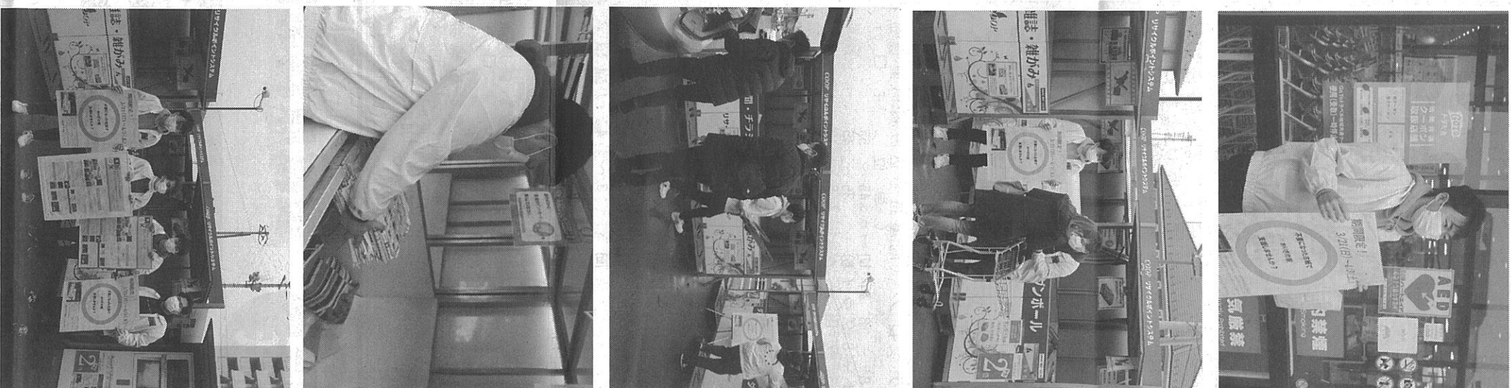
「たんぼぼ」と共同で行っている古紙回収活動

株式会社 エコアール 〒326-0824 栃木県足利市久保田町838-1 TEL 0284-70-0780 FAX 0284-72-1711 URL http://www.eco-r.jp