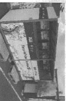
スーパーマーケット敷地内の回収ボックス

お客様からは「いつでも持って行けるので便利」「リサイクルでポイントが貯まるのが楽しい」といった声を頂いている。